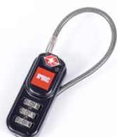
[ HPRCLO ]